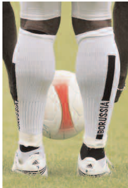
Schnappschuss aus Mönchengladbach: Spannung vor der Freistoßausführung.

Marketing Gesellschaft Mönchengladbach mbH Voltastr. 2 41061 Mönchengladbach