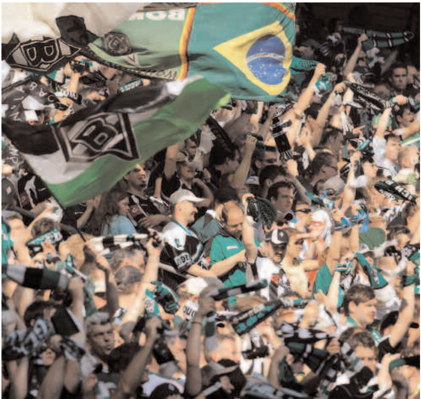
Die Fans im Mönchengladbaacher BORUSSIA-PARK sorgen für gute Stimmung.

Volksgarten T: 02161-405112 F: 02161-405114 www.drk-nordrhein.net d.dohmen@drk-nordrhein.net Anmeldung telefonisch spätestens einen Tag vor dem Spiel Behindertenfahrdienst Böcken T: 02161-895506 keine Anmeldung notwendig ▸ Deutsches Rotes Kreuz Deutsches Rotes Kreuz Kreisverband Mönchengladbach